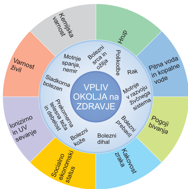
Slika 3: Vpliv okolja na zdravje ljudi

Onesnaženost okolja je pomembna determinanta zdravja, saj se povezuje s številnimi socialno-ekonomskimi dejavniki. Spremljamo jo s kazalniki o okolju in zdravju, ki so pripravljene v skladu z metodologijo Informacijskega sistema za okolje in zdravje (Environment and Health Information System) Svetovne zdravstvene organizacije (SZO) in zato mednarodno primerljivi. Z njimi ugotavljamo doseganje ciljev, ki so v državi sprejeti z namenom izboljšanja stanja na področju okolja in zdravja.